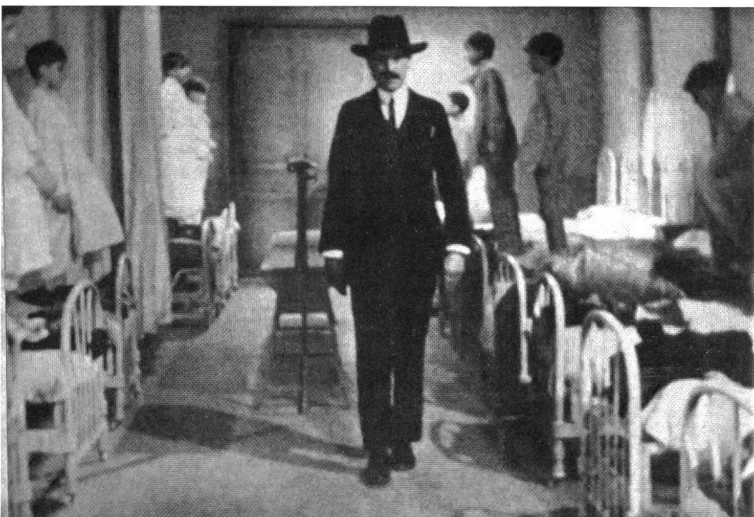
Jugendliche Phantasie und Anarchie gegen patriarchalische Autorität und Repression: Jean Vigos «Zéro de conduite». – Bild rechts: Jean Vigo auf dem Weg zum «poetischen Realismus»: «L'Atalante» (mit Michel Simon als Père Jules).

Das Gas ist es, das die Explosion auf der französischen Seite der Grube auslöst, eine Explosion, der Brände folgen, die viele Menschen verschüttet oder zumindest in den Stollen