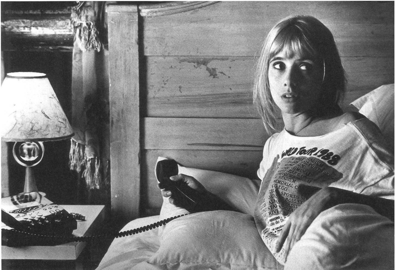
Rosanna Arquette in Martin Scorseses Episode «Life Lessons».

stück liest sie Papas Fanpost, sie kleidet sich mit Vorliebe in Mamas Dior-Ensembles und benutzt Chanel N° 5, um angeschlagene Köpfe zu kühlen. Mit Hilfe des reichsten Jungen der Welt rettet sie die Ehe ihrer Eltern, um am Ende des Films, sehnlichster Wunsch jedes Kindes, zusammen mit ihren Eltern durch die Welt zu gondeln.