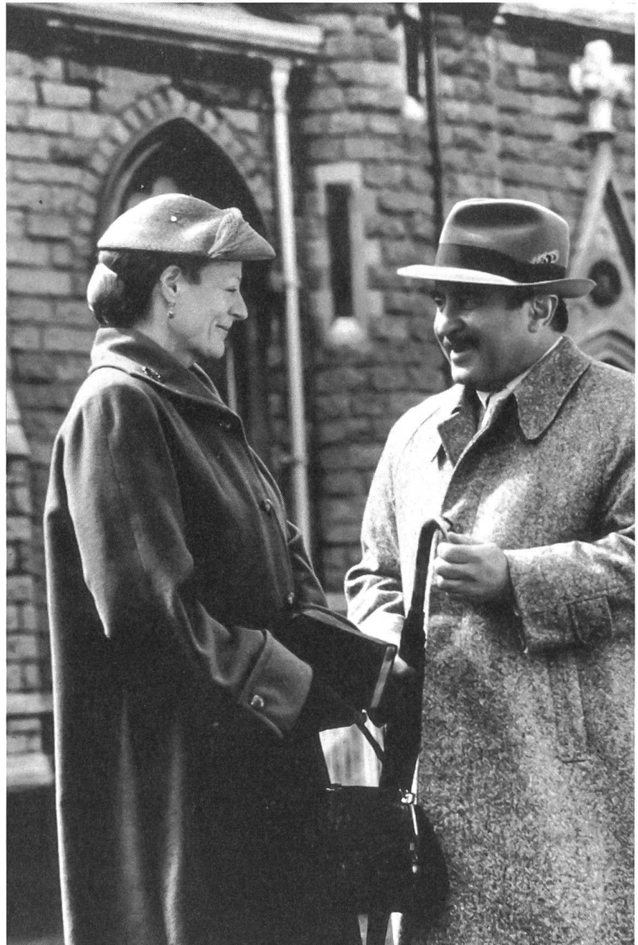
Jack Claytons «The Lonely Passion of Judith Hearne ist voll Sensibilität für Traurigkeit und Lebensmangel. Maggie Smith und Bob Hoskins.

In der Pension, in der sie sich eben wieder eingerichtet hat, begegnet sie einem Mann, dem Bruder ihrer Wirtin, der vor kurzem aus New York heimgekehrt