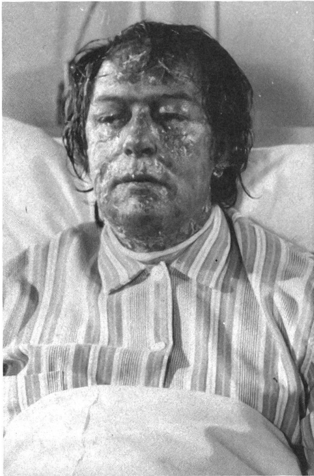
Michael Gambon als kranker Krimi- schriftsteller Philip E. Marlow.

ebenso schmerzlichen Erinnerungen an den einstigen Bruch zwischen Vater und Mutter?