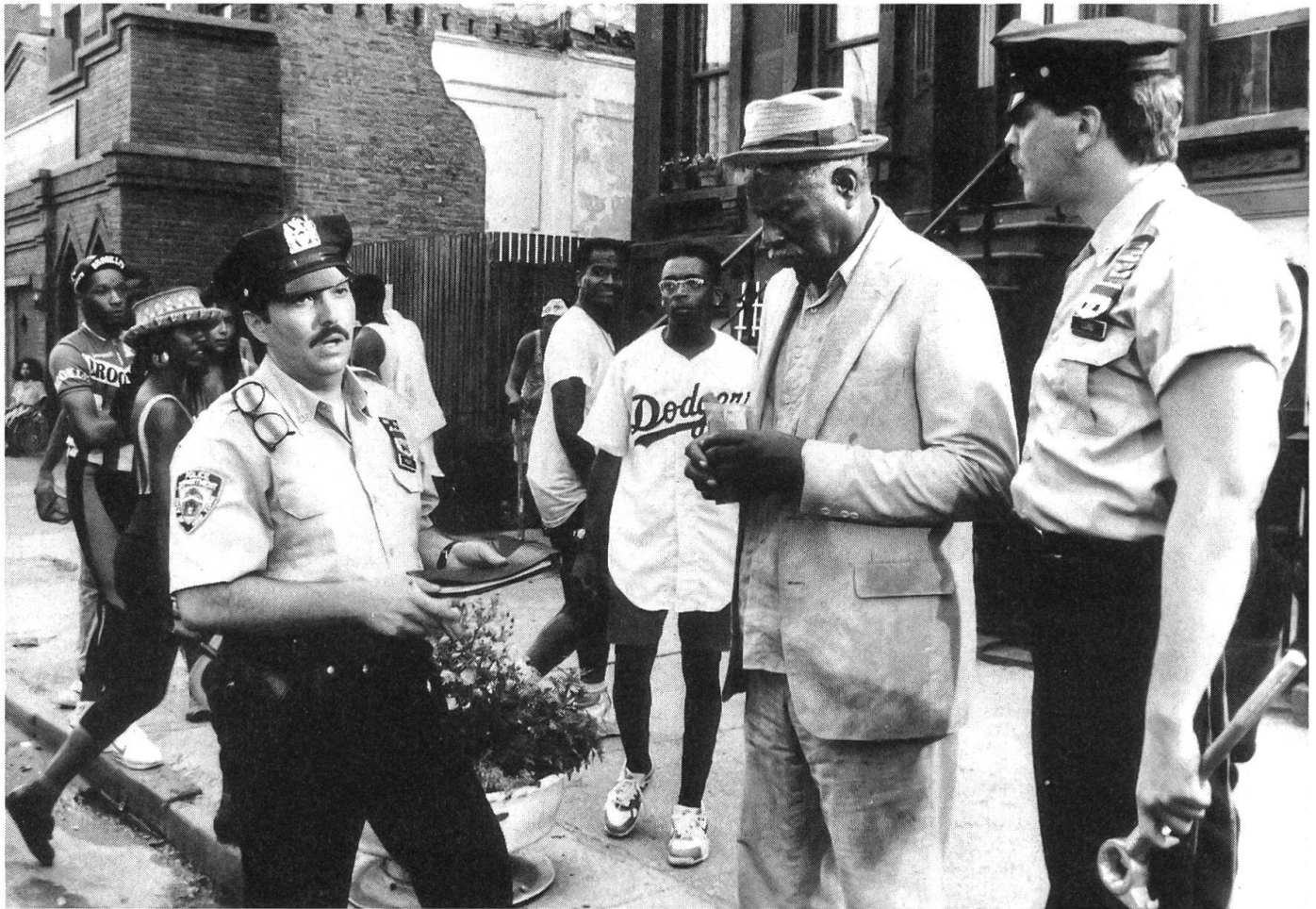
Dem ganz alltäglichen Rassismus im New Yorker Stadtteil Brooklyn spürt Spike Lee in «Do the Right Thing» nach.

bock-Denken wegbringen will. Der Liebenswerteste wird wie zufällig zum «Bösen». Wichtig ist der soziale Mechanismus, nicht die individuelle Psyche.