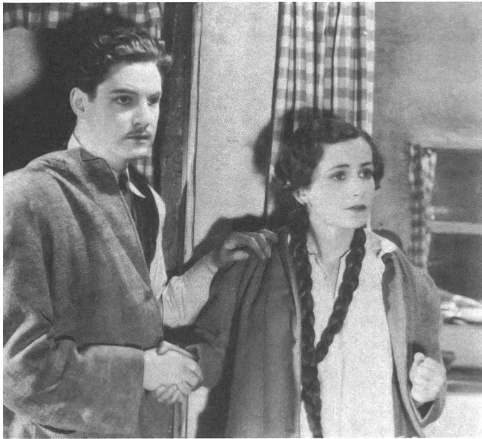
Robert Donat und Peggy Ashcroft in Hitchcocks Suspense-Meisterwerk «The 39 Steps».

Schliesslich siegt das Gemeinschaftsgefühl über den Egoismus. Mit neu erwachtem Elan machen sich die Genossenschaftler daran, den Kampf mit der Natur aufzunehmen. Wenn das Wasser schon nicht zu uns kommt, dann holen wir es eben zu uns. In einem gewaltigen Kraftakt, in Tag- und Nachtarbeit, wird ein Bewässerungskanal erstellt, der das ersehnte Nass auf die ausgetrockneten Felder führt und somit die Ernte rettet.