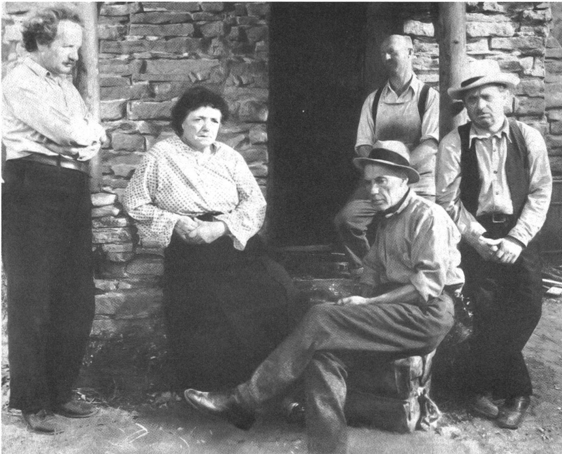
Sozialkritisches Engagement bei King Vidor's «Our Daily Bread» und (Bild rechts) Traumfabrik-Entertainment bei Lloyd Bacons «Footlight Parade», choreographiert von Busby Berkeley.

Mit dieser Ausgangslage beginnt eine temporeiche und langgezogene Verfolgungsjagd voller absurder Zu- und Einfälle,