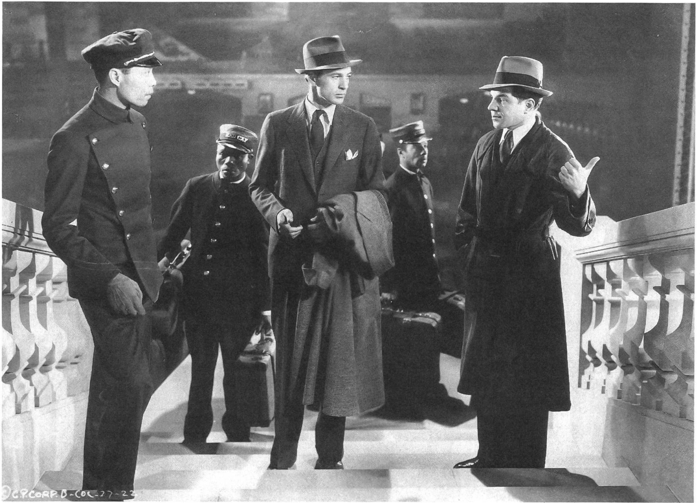
Ein Stück Pioniergeist in die Urbanität gerettet: «Mr. Deeds Goes to Town» mit Gary Cooper.

Chaplins) erfolgreich gegen eine Vereinnahmung durch die Gesellschaft. Longfellow Deeds und Jefferson Smith sind eigentlich zwei Durchschnittsfiguren, allerdings versehen mit einigen Besonderheiten, die der Zufall aus ihrem gewohnten Lebensrhythmus herauswirft und mit der «Macht» konfrontiert. Deeds erbt von einem Onkel zwanzig Millionen Dollar und sieht sich plötzlich von einer Unmenge wohlmeinender «Freunde» umgeben, während Smith zum Senator gewählt wird, jedoch nicht bereit ist, das korrupte politische Spiel mitzuspielen. Beiden gemeinsam ist eine gewisse Naivität, der fast unerschütterliche Glaube an das Gute im Menschen,