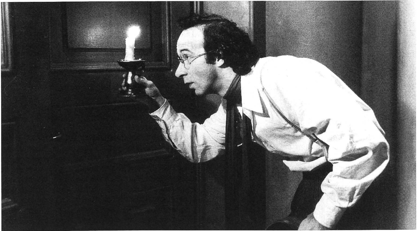
Ausser Konkurrenz: Inständige Bitte um Ruhe («La voce della luna» von Federico Fellini)

In den acht Träumen von «Dreams» schlägt Kurosawa einen Bogen von der magischen Welt der Kindheit über die düsteren Ängste der Erwachsenen zu einer heiteren Paradiesvision des Lebens und Sterbens. Kurosawas Film warnt vor der Zerstörung der Erde durch den Menschen und plädiert für ein einfaches Leben in Harmonie mit der Natur (ausführliche Besprechung in dieser Nummer).