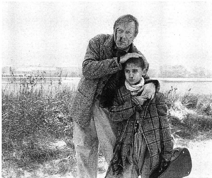
Aus der Sicht eines Kindes erzählt: «Zeit der Rache» von Anton Peschke.

Der Film löste in Locarno heftigste Reaktionen aus. Nach Zensur wurde geschrien, der Festivalleitung Inkompetenz in der Programmauswahl für den Wettbewerb vorgeworfen. Hier würde Tod als Lebensstil zelebriert und die Grenzen des guten