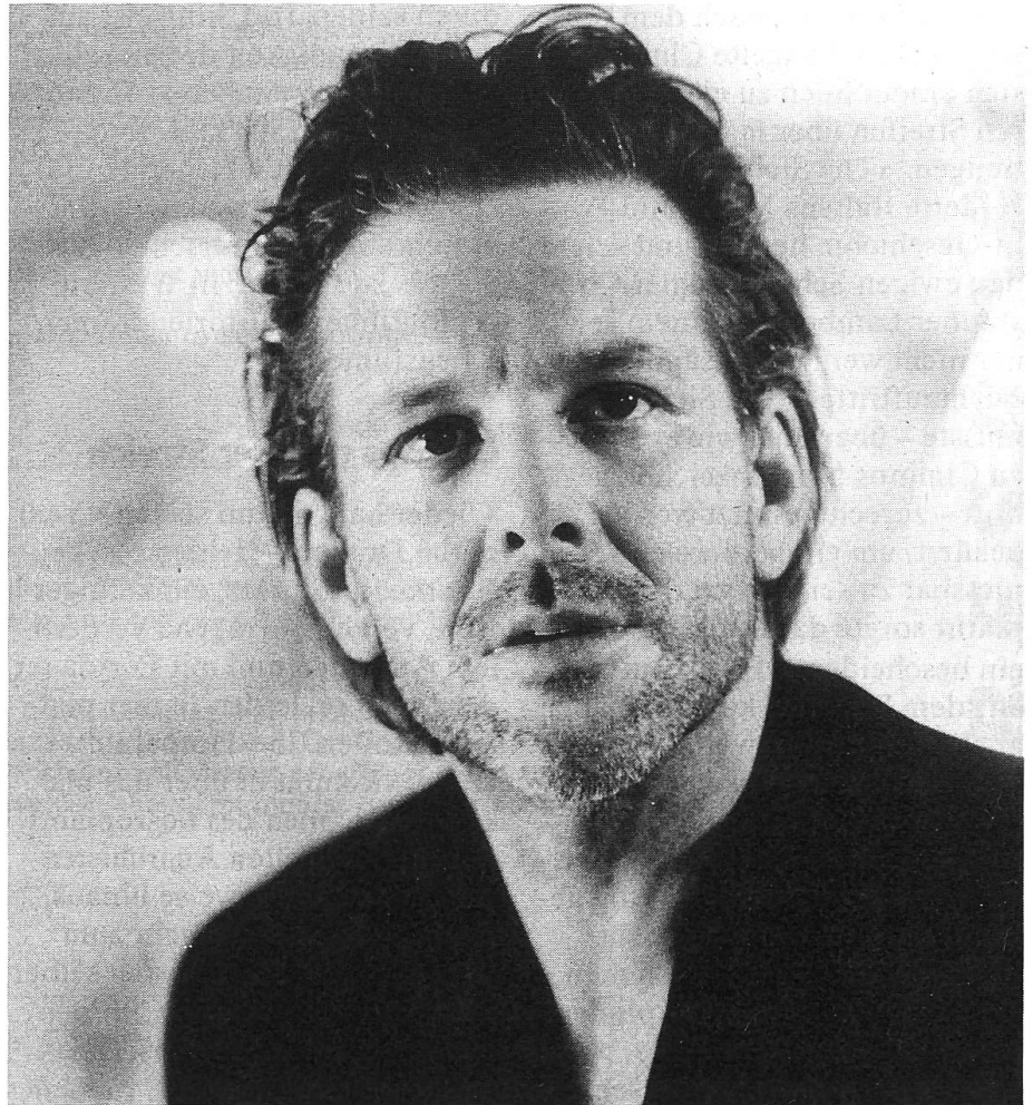
Kerniger Kerl in platter Rolle: Mickey Rourke.

Doch zu Ciminos Handschrift gehört auch die Labilität des Auftritts – Coppola lässt grüs-