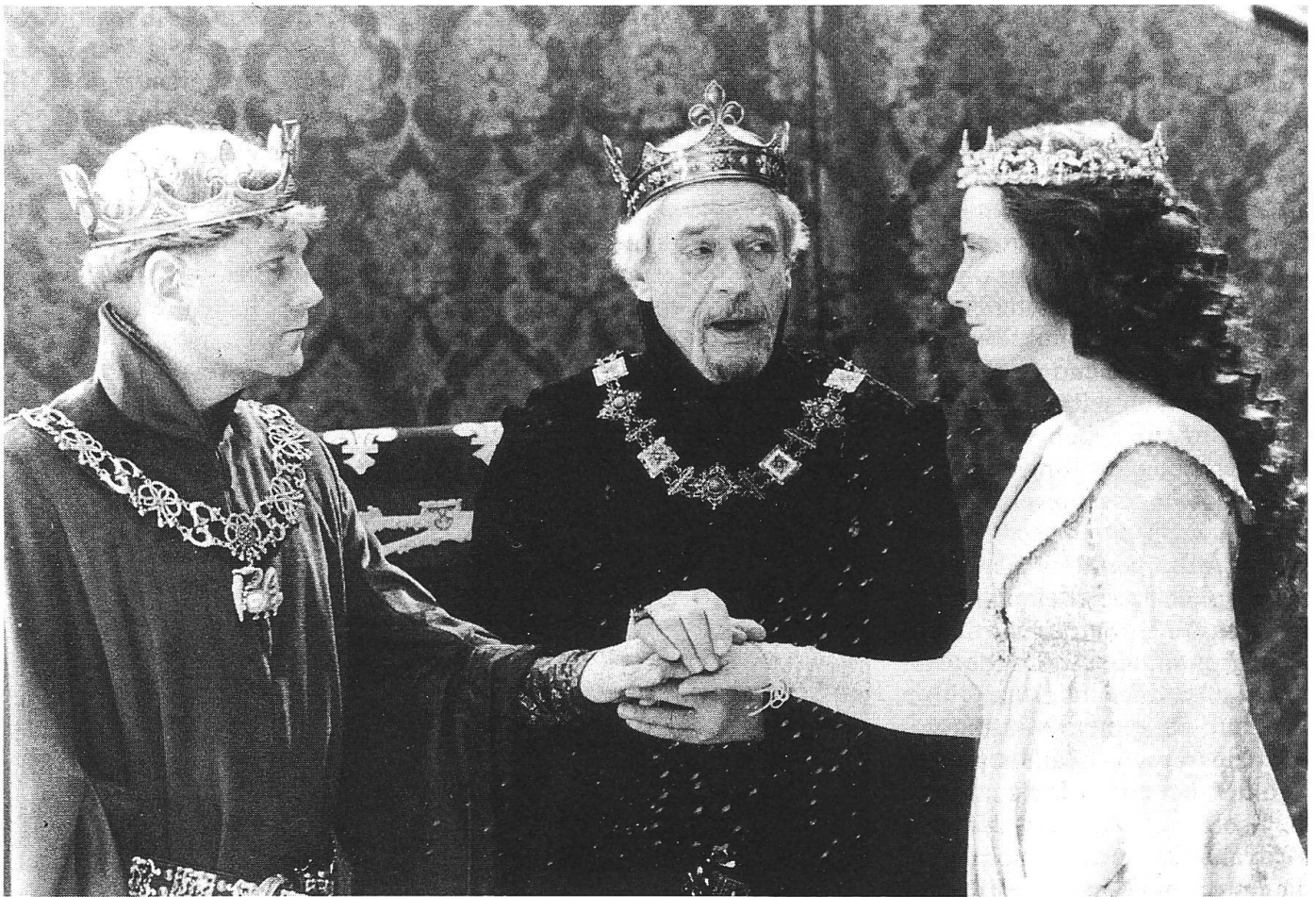
«Henry V»: Shakespeare für ein breites Publikum.

nachgewiesen, dass Henrys Anspruch auf den französischen Thron eine höchst fragwürdige Angelegenheit war. Der erste Akt des Stücks – und damit des Films – weist eindrücklich nach, dass es der englische Klerus war, der dem jungen König nicht nur die juristischen Argumente lieferte, sondern ihn auch von der Gottgewolltheit seiner Mission überzeigte. In einem für historische Laien kaum verständlichen Monolog umkreist der Erzbischof von Canterbury und mit ihm die Kamera den König und die um ihn versammelten Adligen förmlich: «with blood and sword and fire to win your right» (mit Blut und Schwert und Feuer euer Recht zu gewinnen).