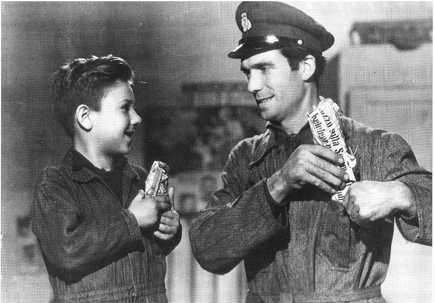
Verknüpft Alltäglichkeiten überzeugend mit Aktuellem: «Ladri di biciclette» von Vittorio De Sica.

teger gebliebener Held. Regisseur De Sica und Drehbuchautor Cesare Zavattini gehen jedoch noch einen Schritt weiter, indem sie Ricci der Versuchung erliegen lassen, Unrecht mit Unrecht zu vergelten. Antonio setzt sich zusammen mit seinem müde gewordenen Sohn an den Strassenrand in der Nähe eines Fussballstadions und erblickt Tausende von abgestellten Fahrrädern. Eine innere Unruhe packt ihn, er schickt Bruno nach Hause, um schliesslich, nach langem Zögern und Ringen mit sich selbst, einen Diebstahl zu begehen. Doch anders als ihm als Bestohlenen das Recht verwehrt blieb, wird er als Täter auf frischer Tat ertappt und sieht sich schweren Demütigungen ausgesetzt, zumal sein Sohn zurückgekehrt ist und die ganze entwürdigende Szene miterleben muss.