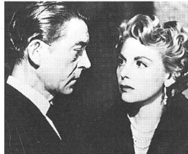
Geschichte des Films in 250 Filmen