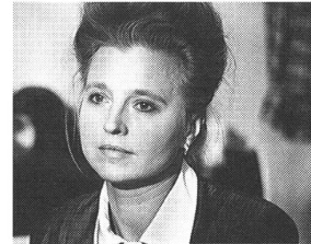
Gespräch mit Hanna Schygulla