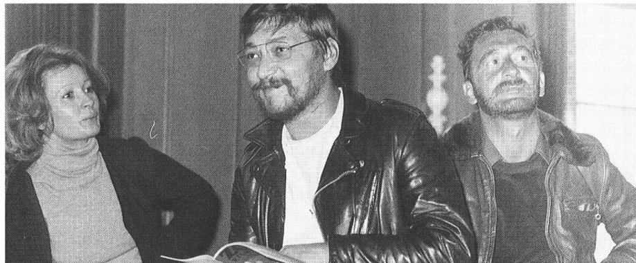
Rainer Werner Fassbinder, Ingrid Caven und Daniel Schmid an den Solothurner Filmtagen 1976