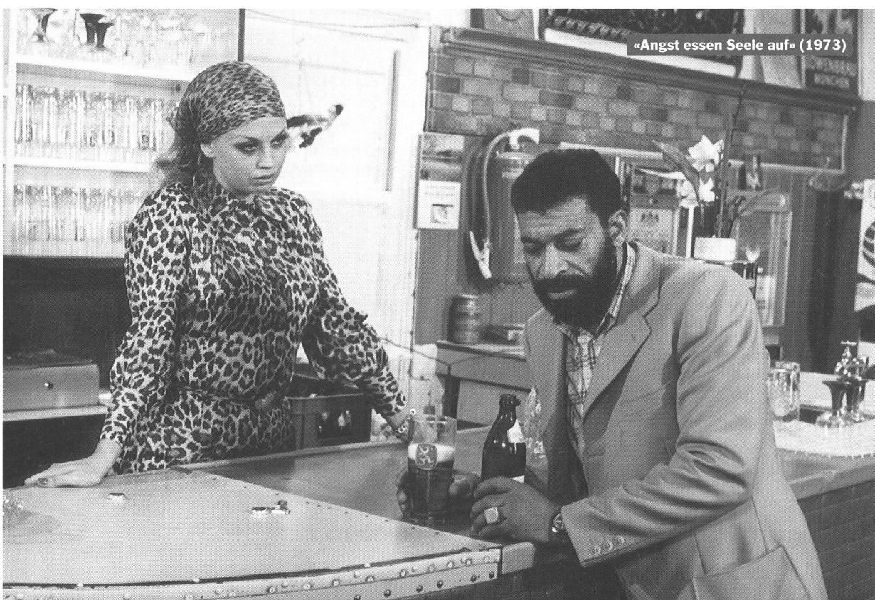
«Angst essen Seele auf» (1973)

Das Leben und Leiden des guten, naiv-triebhaften Franz Biberkopf wurde von Fassbinder als eigenes Erleben nachempfunden, da es seiner Befindlichkeit in der Krisenzeit der Pubertät zutiefst entsprach. Fassbinders Suche nach Identität erhielt durch die Döblinschen Figuren Franz Biberkopf und Reinhold entscheidende Impulse zur Offenlegung und Akzeptierung der eigenen Charakter- und Wesenszüge, der Ängste und