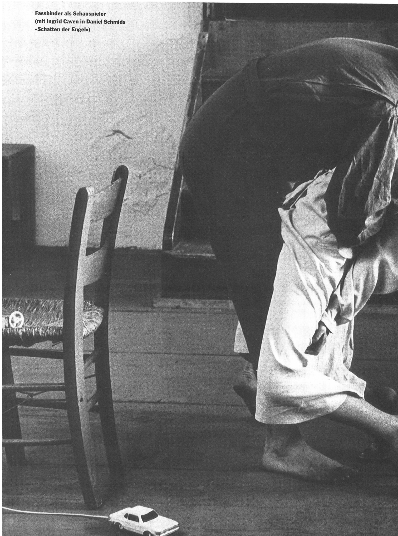
Fassbinder als Schauspieler (mit Ingrid Caven in Daniel Schmid's «Schatten der Engel»)