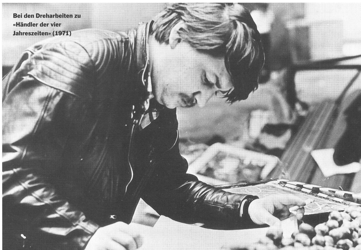
Bei den Dreharbeiten zu «Händler der vier Jahreszeiten» (1971)

Im Frühjahr 1976 gerät Fassbinder mit seinem Theaterstück «Der Müll, die Stadt und der Tod» in die Schlagzeilen. Weil darin ein reicher jüdischer Bauspekulant und ein Antisemit auf-