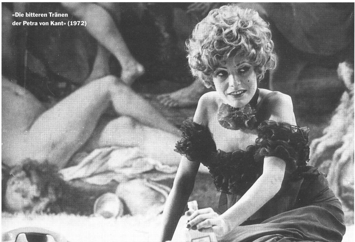
«Die bitteren Tränen der Petra von Kant» (1972)

Einen Schlüssel zu Persönlichkeit und Werk Rainer Werner Fassbinders bietet sein Hauptwerk, die Fernsehserie «Berlin Alexanderplatz». Die Begegnung mit Alfred Döblins 1929 erschienenem Grossstadtepos «Berlin Alexanderplatz. Die Geschichte vom Franz Biberkopf» war für den jungen Fassbinder