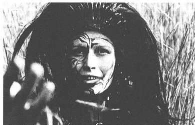
«Der silberne Planet»