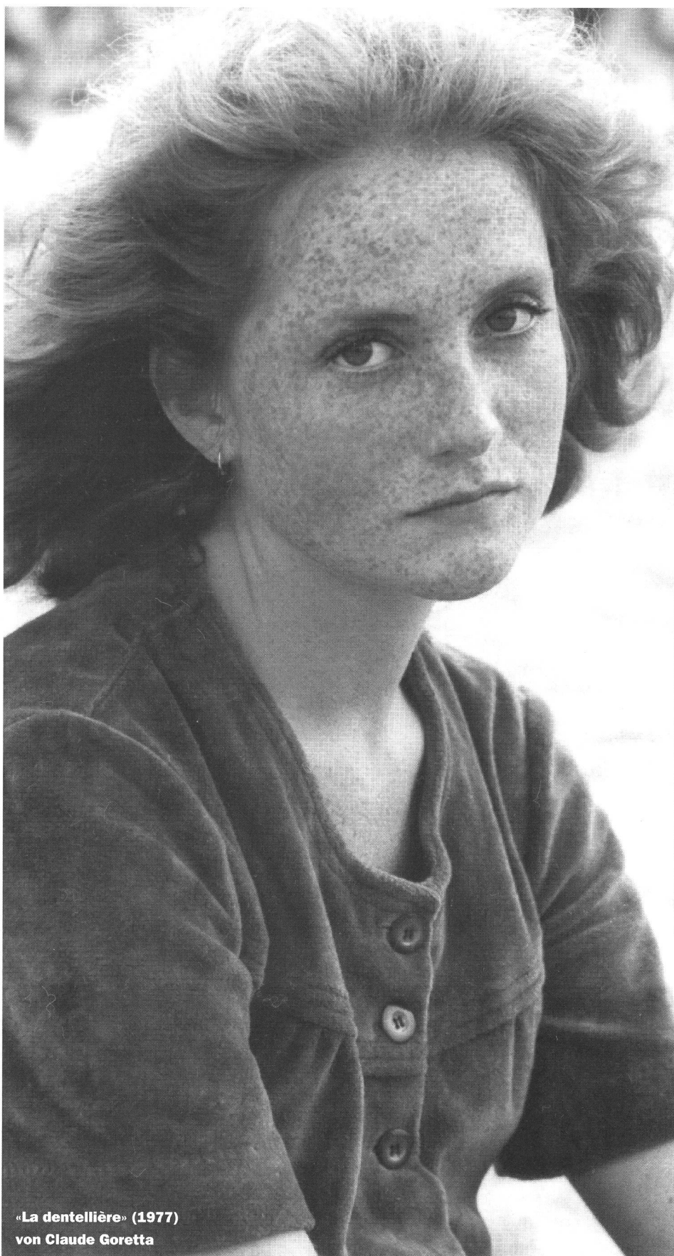
«La dentellière» (1977) von Claude Goretta

Wie hat die Schweiz darauf reagiert? Erstaunlicherweise durch eine Öffnung. Die Berner Film-Politiker haben die Schweiz ins MEDIA-Programm der Europäischen Gemeinschaft eingebracht. Die Zahl der Koproduktionen hat in den letzten Jahren sprunghaft zugenommen. Klar doch: Wenn im eigenen Land das Geld zu wenig, der Markt zu klein ist, sucht man sich ausländische Interessenten und Märkte (oder geht selber ins Ausland: Manchmal entstehen Schweizer Filme inzwischen halt