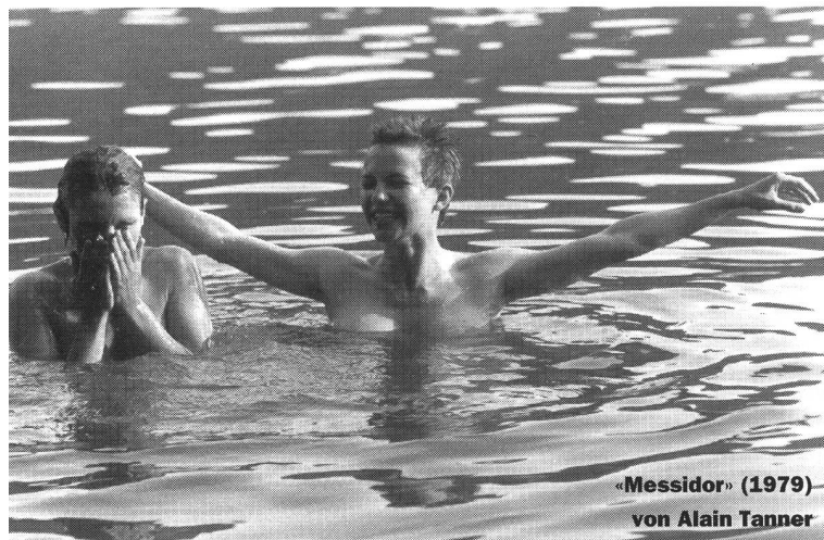
« Messidor » (1979) von Alain Tanner

Wo liegen die Gründe für dieses Abrutschen eines nationalen Films in die Bedeutungslosigkeit? Immerhin hatte der