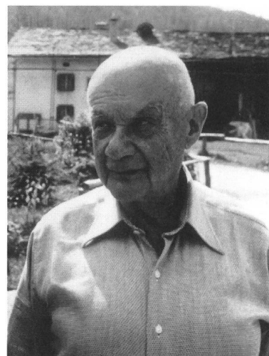
Die versunkenen Welten des Roman Vishniac