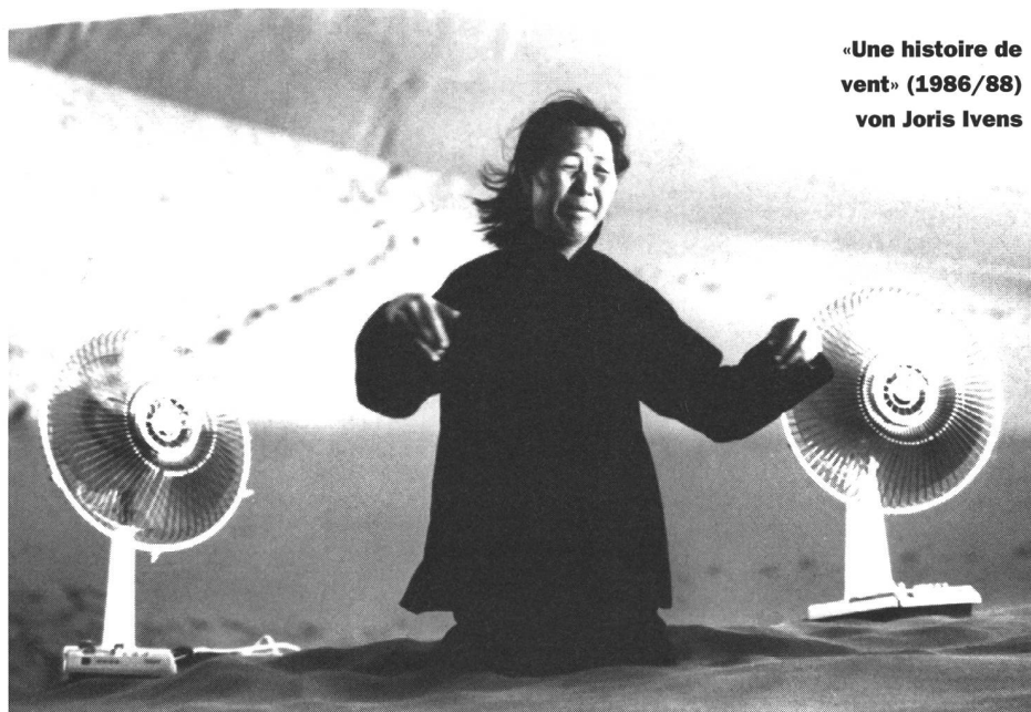
«Une histoire de vent» (1986/88) von Joris Ivens

Yves Yersin realisierte mit «Les petites fugues» (Schweiz/Frankreich 1978) ein wunderbar poetisches Beispiel der inneren Befreiung, die ebenfalls mit Wind versinnbildlicht wird. Pipe, ein Knecht, der sein Leben lang auf dem Hof gearbeitet hat, kauft sich ein Mofa und entdeckt mit wehenden Haaren auf seinem Wunderding die Welt neu. Oben auf