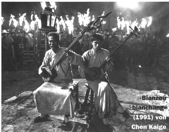
«Bianzou bianchang» (1991) von Chen Kaige

sen Schilffeld wohnt, jede Nacht in blinder Obsession die wogenden Halme. Brillant versteht es Shindo, das optische Schauspiel der Halme auf Celluloid zu bannen, oft arbeitet er mit Nahaufnahmen des übermannshohen Schilfes und des sich kräuselnden Wassers und erzielt so eine fast grafische Wirkung der bewegten Elemente. Die Gefühlswalungen der Liebenden scheinen sich in der Natur zu multiplizieren, das Schilffeld scheint ihnen seelenverwandt zu sein.