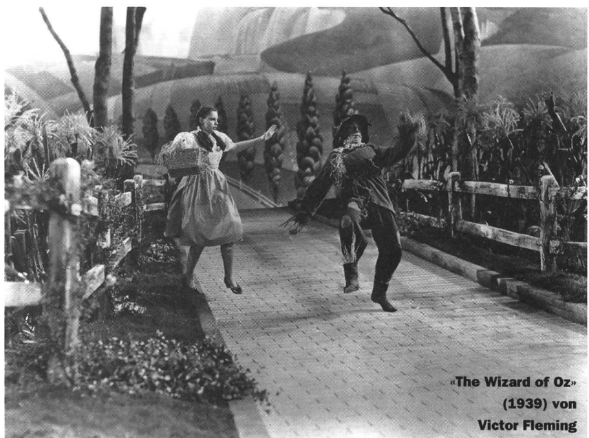
«The Wizard of Oz» (1939) von Victor Fleming

Dass es auch heutzutage Menschen gibt, die auf den Wind angewiesen sind, wie einst die Müller in ihren Windmühlen, die Matrosen auf ihren Seglern, zeigt der französische Ethnograph Jean Rouch. In seinem fiktiv-dokumentarischen Film «Madame L'eau» (Niederlande/Frankreich 1992) besinnen sich drei Bauern aus dem Niger in ihrer Notlage auf den Wind. Ihre Felder sind ausgetrocknet, da der Wasserstand des Nigers von Jahr zu Jahr sinkt. Auf dem sandigen Boden stehend, betrachten sie eine Delfter Kachel mit dem Motiv einer jener wasserpumpenden Windmühlen, die die Besiedlung der unter dem Wasserspiegel liegenden Landschaften Hollands überhaupt erst ermöglichten. Ihr Traum wird wahr: Im