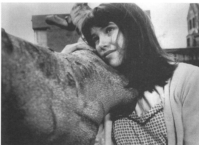
«David and Lisa» (1962) von Frank Perry: erweckte grosse Erwartungen.