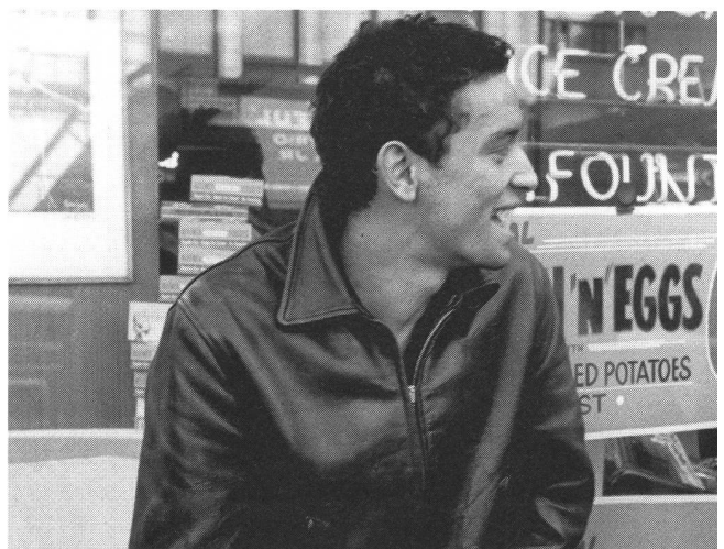
«Shadows» (1958) von John Cassavetes: radikale Einführung eines Stils