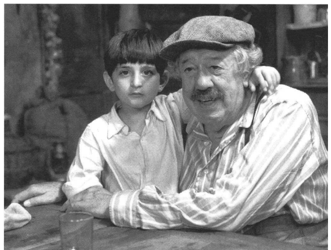
«Le vieil homme et l'enfant» (1966) von Claude Berri: entschlüsselung der Biografie