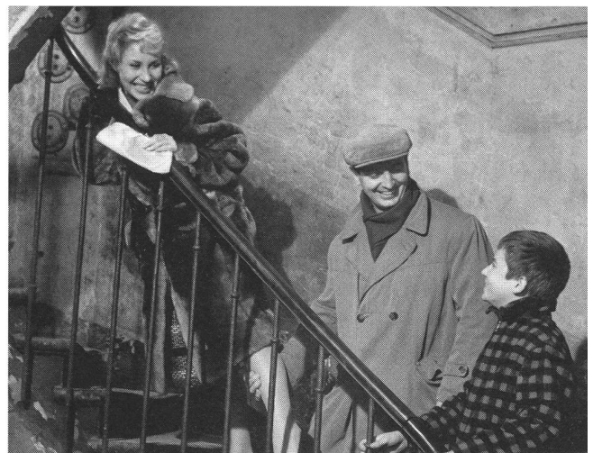
«Les quatre cent coups» (1959) von François Truffaut: vollendete Ausgangsposition für die Fortentwicklung von Stil, Methode und Thema

Das Problem des Debüts als Chance und Gefahr gibt es keineswegs nur im Bereich des ambitionierten Autorenfilms. Auch auf dem Gebiet des Genrefilmes gibt es Regisseure und Regisseurinnen, die mit dem allerersten Film ihr ganzes Können zeigen und an die Kraft des Erstlings später nur annähernd