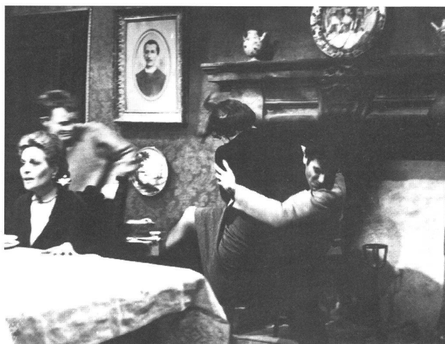
«I pugni in tasca» (1966) von Marco Bellocchio: furioses Zeitbild, das die Vernichtung eines Film-talents einläutete.

Mit der Veränderung von Ökonomie und Politik in der Filmkultur verändert sich freilich auch die Funktion des Debüts. Schon zeichnet sich die Frage nach dem «postmodernen Spielfilmdebüt» ab, das sich in jedem Fall ganz entschieden von dem Debüt der jungen und so oder so «revolutionären» Filmemacherinnen und -macher der vergangenen Jahrzehnte unterscheiden muss. ■ ►