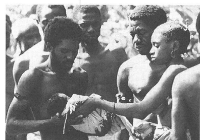
«Et la lumière fut»