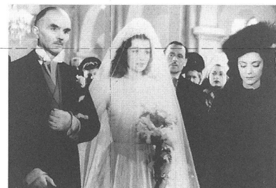
«Les dames du Bois de Boulogne»