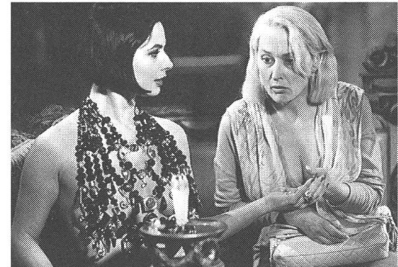
«Death Becomes Her»

Regie: Marcel Carné (Frankreich 1938). - Französische Originalversion bei Filmhandlung Thomas Hitz, Zürich. → ZOOM 12/89