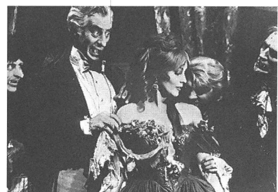
«The Fearless Vampire Killers»