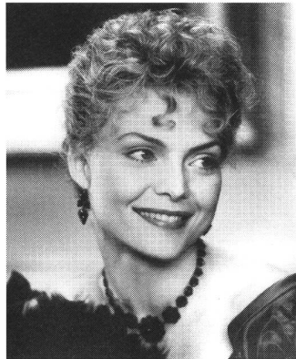
«The Age of Innocence» (1993) von Martin Scorsese

durch die Ich-Erzählung und die Detailfülle der Prosa bedingten Qualitäten verlor, wirkt «The Firm» als Buch seicht und papierern. Grishams Roman ist formal einfalllos und gewinnt seine Spannung aus einem simplen Wettlauf mit der Zeit, dem Zuziehen der Schlinge, in die der allzu naive Held getreten ist. Im Unterschied zu Turows Protagonist Rusty Sabich, der in einem geradezu klassisch anmutenden Dilemma zwischen moralischer Schuld und der amoklaufenden Maschinerie einer überforderten Justiz gefangen ist, versucht Grishams Anwalt Mitch McDeere bloss schnell zu Macht und Geld zu kommen und, als er erkennt, dass er sich mit der Mafia eingelassen hat, seinen Kopf zu retten, ohne sein geliebtes Amtsgeheimnis zu verletzen: ein Filmstoff, wie er (des öftern) im Buche steht. Sydney Pollacks flotte Inszenierung (1993) nun knüpft an seinen verwandten Paranoia-Thriller «The Three Days of the Condor» (1974) an, und in den vielen Luft-Löchern von Grishams Roman finden Drehbuchautoren wie David Rabe, David Rayfiel und Robert Towne viel Platz für Dialogwitz. Charakterdarsteller wie Gene Hackman, Jeanne Tripplehorn, Holly Hunter, Ed Harris und David Strathairn verleihen ihren Figuren ein Gesicht und ein Profil, wie es der Autor der Vorlage