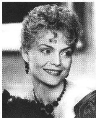
«The Age of Innocence» (1993) von Martin Scorsese

John Grishams Geldwäscher-Bestseller «The Firm» wurde bereits vor der Buchveröffentlichung von Paramount aufgeschnappt. Gemessen an ähnlichen Insider-Krimis wie Scott Turows «Presumed Innocent», der bei seiner Verfilmung durch Alan J. Pakula (1990) viele von seinen