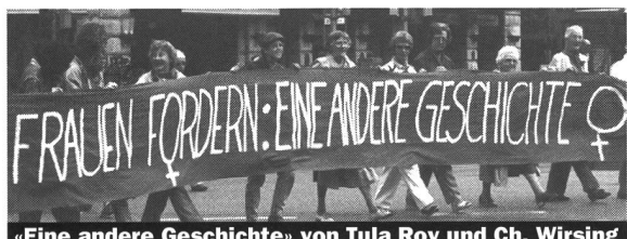
«Eine andere Geschichte» von Tula Roy und Ch. Wirsing

Zumindest zwei der in Solothurn erstaufgeführten Dokumentarfilme bieten sowohl thematisch wie formal durchaus «Neues»: Samirs «Babylon 2» berichtet unter Verwendung modernster Videotechnik von der Befindlichkeit der zweiten Generation von Ausländerinnen und Ausländern im Spannungsfeld zwischen ihrer ganz unterschiedlichen kulturellen Herkunft und einem meist spröde abweisenden schweizerischen Milieu (vgl. dazu Martin Schlappners Kritik S. 30). Formal sehr innovativ ist auch «Well Done» von Thomas Imbach, der mit leichtem Videogerät während Monaten den Finanzwelt-Büroalltag in einer welt-