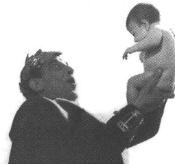
Geschichte des Films