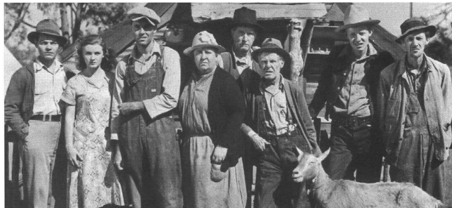
«The Grapes of Wrath» (1940) von John Ford