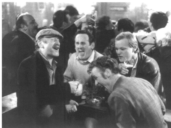
Subversive Farce auf die romantische Liebesese: «The Snapper» von Stephen Frears

Um die Geburt eines unehelichen Kindes, das respektlos « The Snapper » – der Knirps – genannt wird, dreht sich die chaotische Tagikomödie von Stephen Frears. Der Film gleicht einem derben Trinklied, in dem versoffene