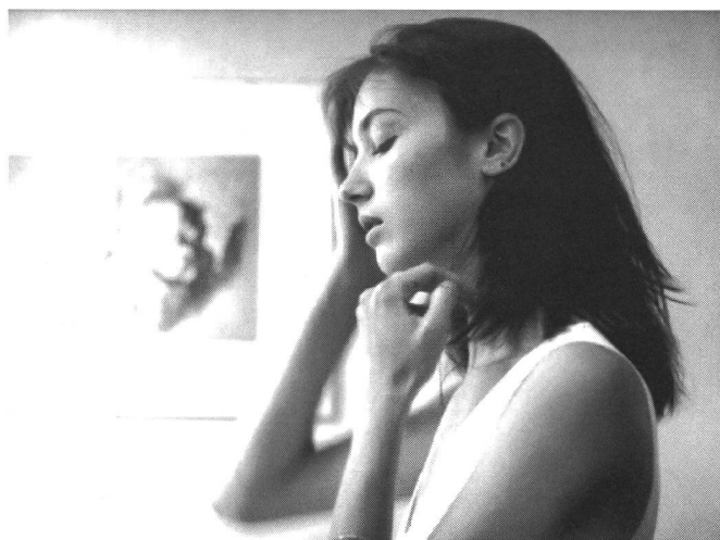
Dem werdenden Leben sein Geheimnis lassen: «Je vous salue, Marie» von Jean-Luc Godard