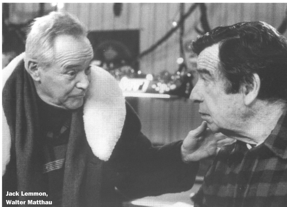
Jack Lemmon, Walter Matthau

Gleich zu Beginn erfährt man, dass sich die beiden Nachbarn schon seit ihrer gemeinsamen Kindheit streiten, mit Kraftausdrücken bewerfen und irgendwie doch in einer kuriosen Feind-Freundschaft aneinander hängen. Beide sind lange schon verwitwet, und als in das Haus nebenan eine vollbusige, jugendlich kokettierende Fünfzigerin einzieht, reaktivieren die beiden im ungelenkten Balzritual aus der Übung geratener alter Männer das ganze Arsenal ihrer lange erprobten gegenseitigen Bösartigkeiten.