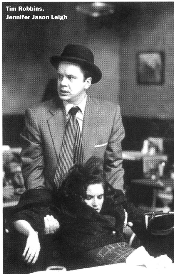
Tim Robbins, Jennifer Jason Leigh

Zur gleichen Zeit stürzt sich Waring Hudsucker, Präsident und Gründer der Firma, aus dem 44. Stock. Um nun die viel zu teuren Aktien in den Keller zu treiben und danach aufkaufen zu können, sucht der Vorstand, allen voran der machiavellistische Sidney J. Mussburger (Paul Newman), einen Schmock, den er als unfähigen Präsidenten der Öffentlichkeit präsentieren kann. In Norville scheint Mussburger den idealen Mann gefunden zu haben. Amy Archer (Jennifer Jason Leigh), eine hartgesottene und mit dem Pulitzer-Preis ausgezeichnete Journalistin, wittert eine heisse Story und pirscht sich mittels hinterlistigen