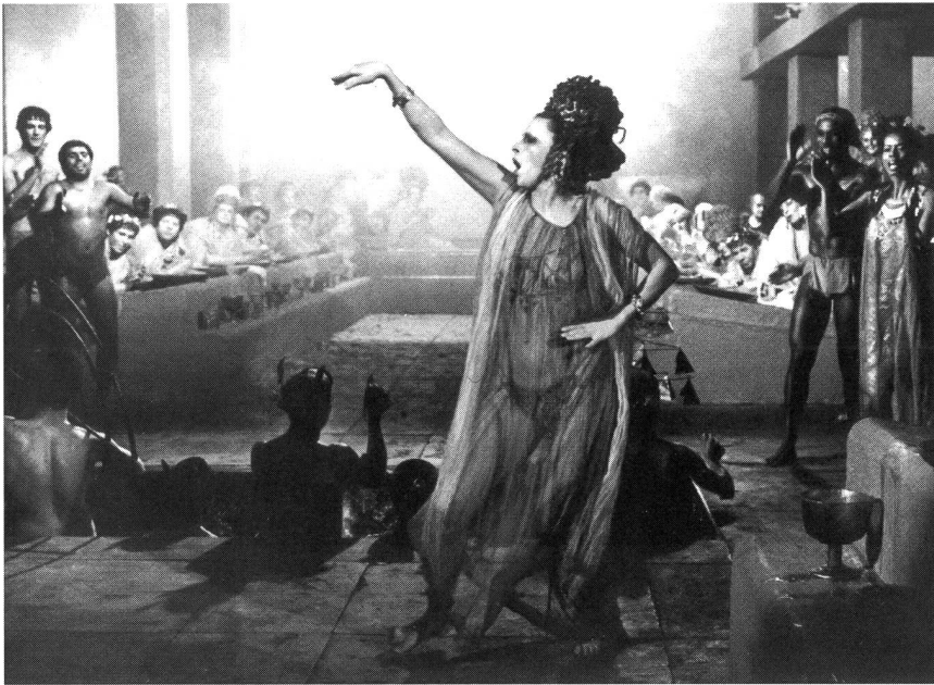
Kennzeichnend für den Kostümfilm: Erfindungsgeist vor Authentizität («Satyricon», Federico Fellini, Italien 1969)

Das 19. Jahrhundert kommt immerhin noch auf etwa eine Veränderung alle zwei Jahrzehnte. Vom 18. Jahrhundert rückwärts wird der Rhythmus (nicht nur im Film) gemächlicher. Bis zur Renaissance hin ist kaum mehr als ein Stil je Jahrhundert zu vergeben. Dann geht's in die Siebenmeilentiefel. Vestimentäres Mittelalter gibt's laut Kino anscheinend nur ein einziges. Und das gesamte Altertum unterteilt sich nur noch nach Völkern. Egal wie alt, die alten Römer haben einfach (ein bisschen) anders auszusehen als Griechen oder Ägypter. Passenderweise ist es im übrigen ein Film, der den ganzen steten Wechsel schlagend veranschaulicht. « The Time Machine » (George Pal, USA 1959) tut bei laufender Zeitmaschine einen Blick in die Auslage eines Modegeschäfts. Auf einer Anprobepuppe passieren gerafft die Stile aller Perioden Revue. So galoppiert das Kleiderpferd. Aus all dem wird ersichtlich, dass diejenigen Kinostücke am heikelsten zu kostümieren sind, die neuere Epochen porträtieren. Das Gestern, das sie zeigen, steckt noch in der Erinnerung der Lebenden und ist leichter zu überprüfen. Die ganze lange Reihe sogenannt nostalgischer Filme, die uns seit gut zwanzig Jahren beharrlich begleitet, nährt sich nicht zuletzt von der Lust an der Mode vergangener Tage, sprich von der Unlust an der heutigen.