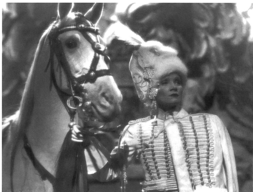
Früher Inbegriff des historischen Filmkostüms: Marlene Dietrichs russische Pelzhüte und -jacken («Scarlett Empress», Josef von Sternberg, USA 1934)

Denn wenn es heisst, Kleider machen Leute (oder andere ausgestaffte Lebewesen), dann ist damit gemeint, dass die Wirkung nicht vom einzelnen Aufzug, sondern von der Garderobe, von der Kollektion ausgeht. Stil beginnt mit der Wahl eines zweiten Complets (mindestens). Wer immer gleich unverkleidet bleibt, scheint allzu identifizierbar und festge-fügt. Das vielfältige fortgesetzte Rollenspiel hingegen, die unerwartete Wahl eines Hutes oder Hemdes lösen – wenig-stens optisch, wenigstens scheinbar – aus der introvertierten Fixiertheit und der Anonymität der Masse heraus. Moden zehren von diesem Bedürfnis, die Kleidermode natürlich allen voran. La mode, c'est ce qui se démode . Wie die Kostüme ►