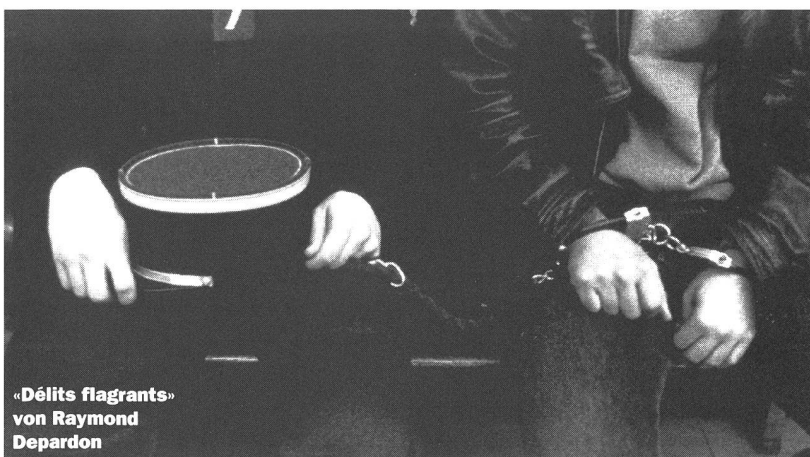
«Délits flagrants» von Raymond Depardon

Es sind diese Filme, «Tianguo niezi», «Délits flagrants», «Rhythm Thief» oder «L'appât», die das Leben eines Filmkritikers angenehm machen. Man findet sie fast nur noch an einem Filmfestival. An diesem fernen Ort, wo die kulturelle Vielfalt noch kein Phantom ist. ■