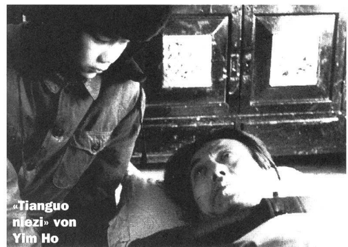
«Tianguo niezi» von Yim Ho

die Geschichte dieser Familie. Am Schluss, nachdem die Polizei den Leichnam ausgegraben hat, kann anhand einer Knochenanalyse festgestellt werden, dass der Vater vergiftet worden ist. Die Mutter und ihr zweiter Mann, der am Mord mitschuldig ist, werden zum Tode verurteilt. Die beiden haben eine zehnjährige Beziehung im Wissen um dieses