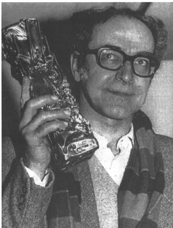
Ehren-César 1987 für JLG