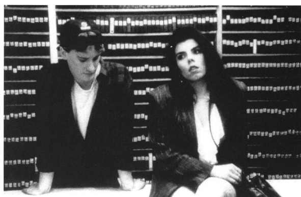
« Clerks » von Kevin Smith