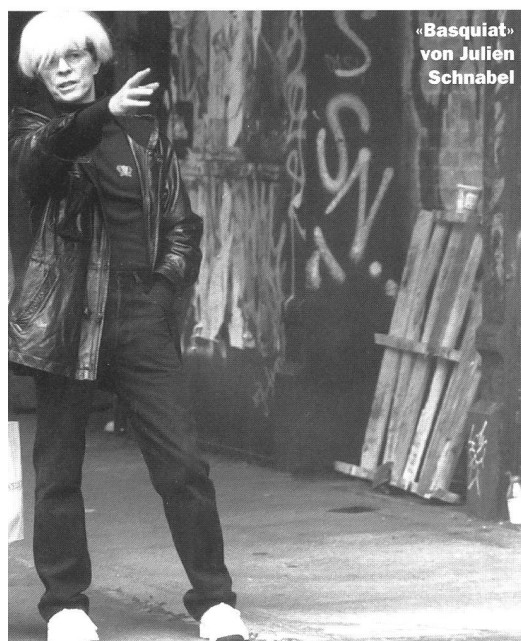
«Basquiat» von Julian Schnabel

Ebenfalls an einer realen Figur orientiert sich Neil Jordan in seinem Film « Michael Collins ». Allerdings an einer, die nicht wie Basquiat zur jüngeren Vergangenheit, sondern zur Historie zu zählen ist. Collins war anfangs des Jahrhunderts einer der Protagonisten des irischen Unabhängigkeitskampfes, welchen der Regisseur geschickt personifiziert. Mag da aber noch soviel Ambition und guter Wille zur Geschichtskorrektur Pate gestanden haben, Jordans Film ist letztlich, was die Spaltung Irlands betrifft, nur bedingt aufschlussreich. Collins, gespielt von Liam Neeson, zieht alle Register gegen die Engländer, ist so unverfroren wie mutig. Scharmützel und andere tragisch-blutige Ereignisse jagen sich in gewohnter Manier amerikanischer grosser Kinokisten, alles ist hochdramatisch aufbereitet. So bleibt wenig Raum zu zeigen, wie ein verzwickter Zwist in den Zwanzigern zur Teilung der Insel geführt hat: Hintergründe ertrinken in vordergründigem Spektakel, in durchgestylten graublauen Bildern. Mag man das bei Filmen, die historische Stoffe erzählen, gemeinhin hinnehmen, ärgert man sich hier darüber, weil die Geschichte in der Realität nicht abgeschlossen ist, der Konflikt ►