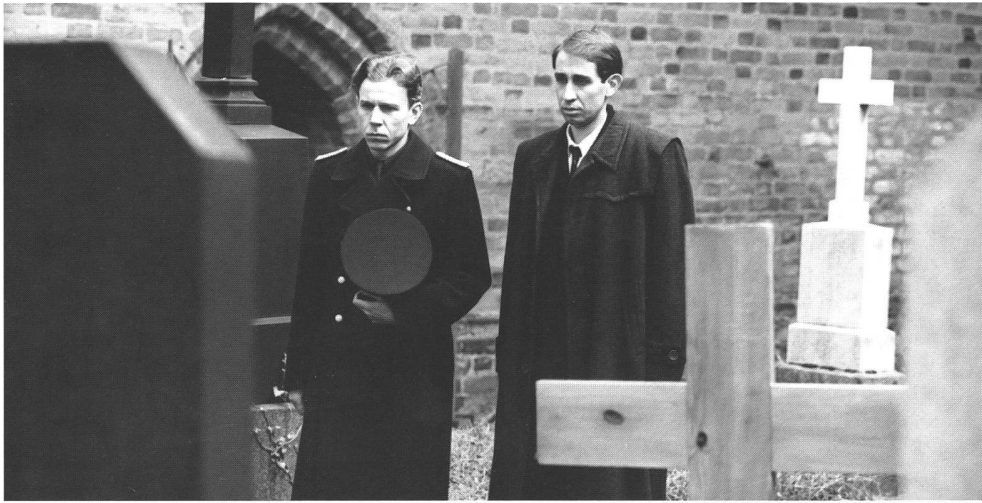
Einer der wichtigsten Filme der Vorwendezeit: «Einiger trage des anderen Last...» von Lothar Warneke, 1987

Vorwendezeit, ein Plädoyer für einen Konsens zwischen Marxisten und Christen. Dieser Versuch wurde vom Publikum durchaus angenommen, der Film stand lange im Zentrum eines gesellschaftlichen Diskurses. Doch der harmoniesüchtige Warneke, studierter Theologe und Filmmemacher, war es auch, der sich nach 1989 so schwer tat wie keiner seiner Kollegen. Für ihn ergab sich keine Möglichkeit, durch Brotarbeiten fürs Fernsehen zu überleben. Er versuchte sich in den vergangenen sieben Jahren an einem einzigen Projekt: dem langen Dokumentarfilm «Zwei Schicksale oder Eine kleine Königstragödie» (1993), in dem er vom Leben eines Kollegen, des kürzlich verstorbenen DEFA-Regisseurs Richard Groschopp, in Konfrontation mit der Biografie eines cleveren (west-)deutschen Geschäftsmanns erzählt. Doch kein Verleih, kein Fernsehsender interessierte sich bisher für diese Arbeit, in der Warneke deutsche Geschichte im Lebenslauf zweier sehr unterschiedlicher Deutscher spiegelt.