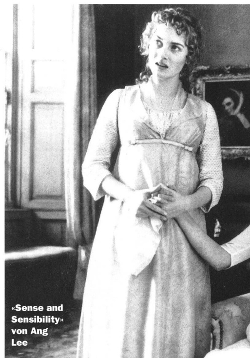
«Sense and Sensibility» von Ang Lee

Mag sein, dass die gepflegte Oberfläche der Filme eine gewisse Wirkung erzielt, aber sie kann kaum allein ausmachen, was die Menschen ins Kino lockt, sonst müssten auch andere historische Stoffe den gleichen Attraktionswert besitzen. «Restoration» (Michael Hoffman, 1995), «The Scarlet Letter» (Roland Joffé, 1995) und «Jane Eyre» (Franco Zeffirelli, 1996), die etwa gleichzeitig in