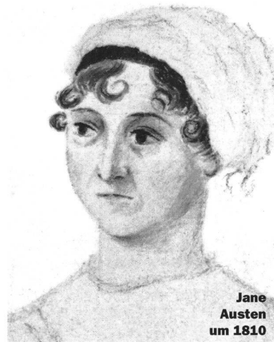
Jane Austen um 1810

Auch andere Versuche, das jugendliche Interesse zu deuten, treten zu kurz. Da kann man lesen, es seien wohl die eleganten Häuser, die schöne Kleidung, der zivilere Umgangston, deren Reiz sich junge Leute kaum entziehen könnten.