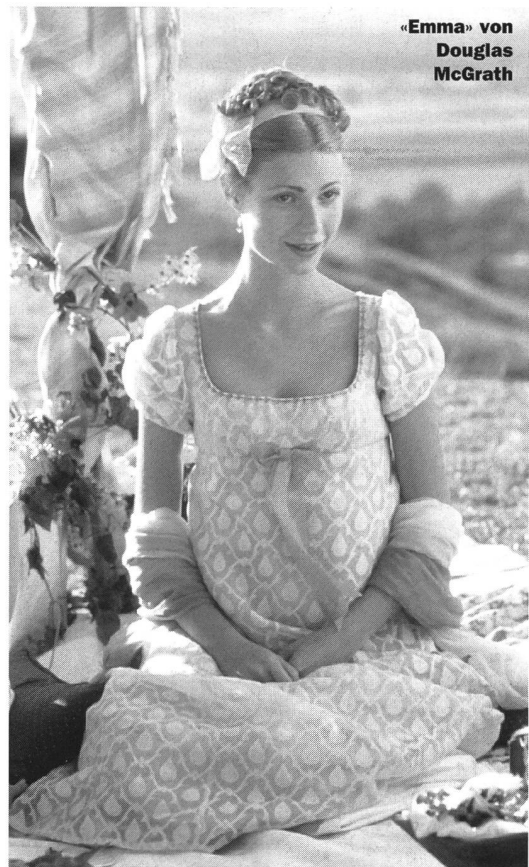
«Emma» von Douglas McGrath

Das alles spielt sich jedoch in einem Klima festgefügtter Ordnung und vor dem Hintergrund einer nie in Frage gestellten Ethik ab. Jane Austens Heldinnen und Helden sind Menschen mit Fehlern und Schwächen. Wären es es nicht, niemand würde sich in ihnen wiederfinden. Sie existieren aber und kommunizieren miteinander in einem Milieu, das gute Sitten und Ideale noch als solche anerkennt. Die äusserlichen Eigenarten und Umgangsformen bewahren sie vor der Vulgarität, und auch wer Unrecht tut, weiss noch um die öffentliche Missbilligung seines Verhaltens. Wer in Jane Austens Welt seinem Gegenüber mit ausgesuchter Höflichkeit einen Stich ins Herz versetzt, tut das für die Leserin und den Leser – und für das Filmpublikum – im klaren Bewusstsein der Tatsache, dass er damit gegen den Konsens seiner Umwelt verstösst. Bei aller Wurmstichigkeit und Unvollkommenheit ist diese Welt nicht nur in ihrer äusseren Erscheinung, sondern auch in ihrem inneren Gefüge das deutliche Gegenteil der amerikanischen Gesellschaft. Man muss gar nicht so weit gehen wie