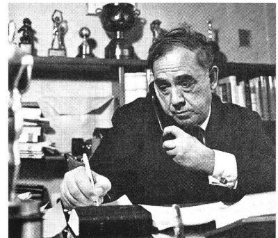
Vater des Schweizer Films: Lazar Wechsler.

Historisch trifft es zwar zu, dass die Ära Wechsler bereits zu Ende gegangen war, als Lazar Wechsler 1981 im Alter von 85 Jahren starb. Historisch trifft es aber auch zu, dass dieser Mann, dessen Lebensintensität dem Ziel, das er sich gesetzt hatte, nahegekommen ist, mit Instinktsicherheit Filme hervorbrachte, die – wie Leopold Lindtberg (1902 – 1984), der ebenfalls jüdische Regisseur an seiner Seite, an seinem Grabe sagen durfte – «in unmenschlichen Zeiten Humanität und manchmal auch sogar etwas wie Poesie» zeigten. Der Mann war in der Tat der «Vater des Schweizerfilms». Dass ihm, dem Juden, dieser Titel eines Tages gegeben würde, war für ihn in jener Zeit, als er mit Lindtberg «Füsilier Wipf» (1938), «Landamann Stauffacher» (1941), «Marie-Louise» (1943) und «Die letzte Chance» (1945) dreht, keineswegs ahnbar, wurde ihm doch damals ins Gesicht bestritten, dass seine Absicht, mit seinen Filmen für die Schweiz etwas Ermutigendes zu tun, redlich sei. In den Amtsstuben des Bundeshauses und wo immer in Institutionen wie der Eidgenössischen Filmkammer oder in kriegsbedingten Behörden wie der militärischen Zensur Wächtersassen, sorgten diese sich darüber, dass dem Land vom Gründer der Praesens und