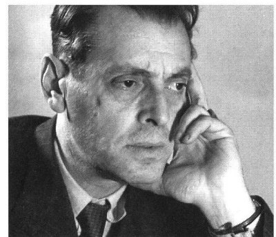
Dank ihm fand der Schweizer Film weltweit Beachtung: Leopold Lindtberg