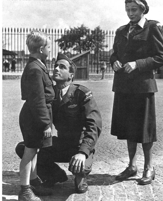
Mit drei Oscars ausgezeichnet: «Die Gezeichneten» von Fred Zinnemann