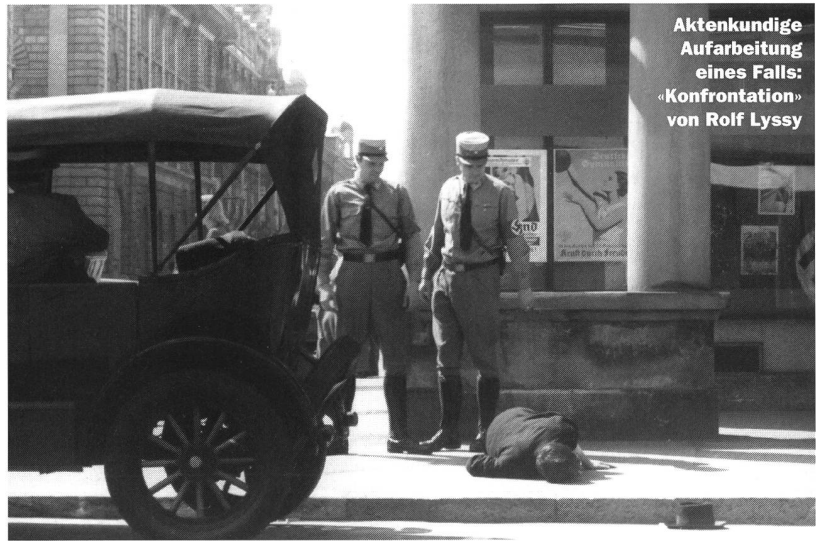
Aktenkundige Aufarbeitung eines Falls: «Konfrontation» von Rolf Lyssy