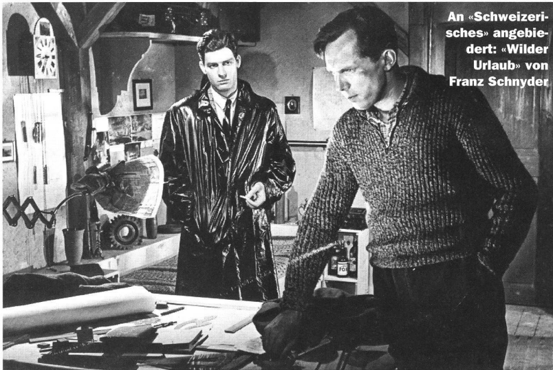
An «Schweizerisches» angebiert: «Wilder Urlaub» von Franz Schnyder

lösung der Judenfrage» mitschuldig geworden ist.