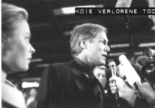
«DIE VERLORENE TOCHTER»