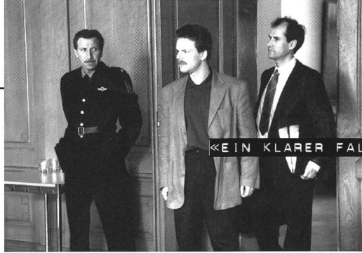
«EIN KLARER FALL»