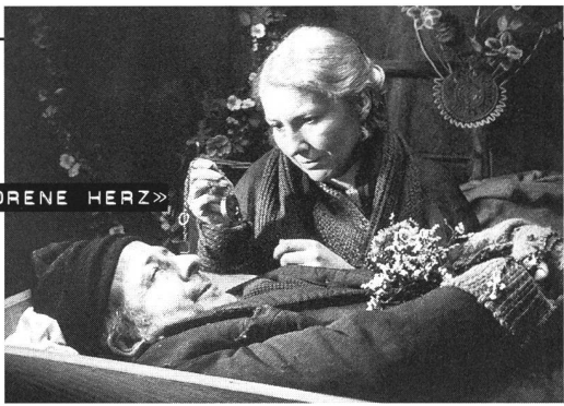
«DAS GEFRORENE HERZ»