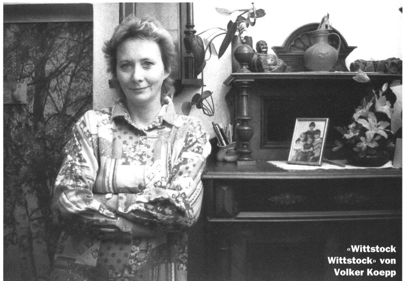
«Wittstock Wittstock» von Volker Koepp

Zur Strategie der Verlangsamung gehört auch der Aspekt der Beharrlichkeit. Durch die Arbeit an einem Thema über mehrere Jahrzehnte entsteht eine Entwicklungslinie, eine filmische Verdichtung der Alltagsgeschichte. «Die Filme müssten nach dem Happy-End eigentlich weitergehen», sagt eine der drei por-