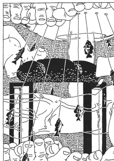
Die Tagung fand vom 19. – 21. Juni in der Kölner Cinemathek statt. Von Heinz Emigholz gibt es ein wunderschönes Buch zur Theorie der Bildproduktion, das auch Fotografien und Zeichnungen von ihm enthält.