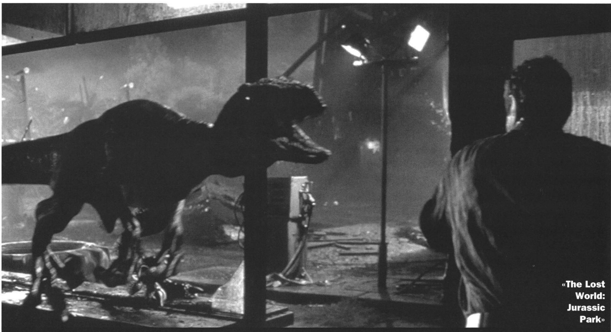
«The Lost World: Jurassic Park»

Ein weiteres Ereignis der Rückversicherung der Studios bei früheren Erfolgen ist das Wiederaufleben des Kriegsfilms. Damit keine Wunden aufgerissen werden, wird als Schauplatz der neuen Filme ausnahmslos der lange genug zurückliegende Zweite Weltkrieg dienen. Der, denkt man wohl, ist für die meisten Amerikaner in so weite Ferne gerückt, dass er – wie ein mittelalterliches Schlachtgetümmel – den emotional wertfreien Hintergrund für