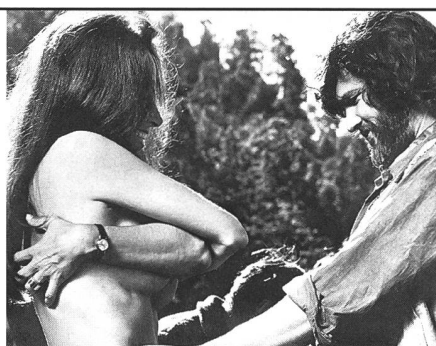
«Bring Me the Head of Alfredo Garcia»