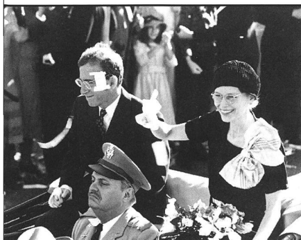
Von namhaften US-Regisseuren für die Retrospektive von Locarno ausgewählt: verkannte Meisterwerke der letzten fünfzig Jahre. Ihre Auswahl unterscheidet sich zum grossen Teil von dem, was aus europäischer Sicht (im Text) zu den highlights zählt.

Für ein Weilchen mag die Show weitergehen. Aber es wird nie wieder so, wie's einmal war. ■