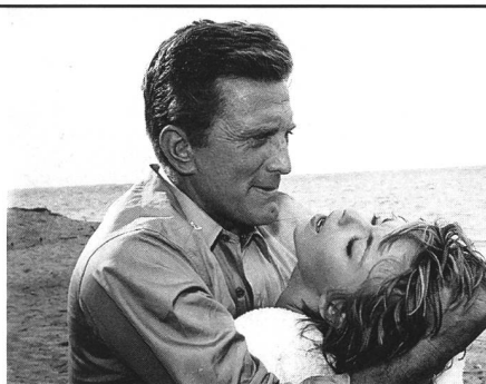
«In Harm's Way»