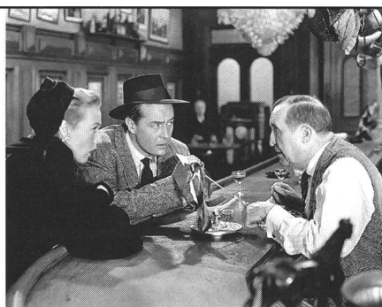
«The Big Clock»