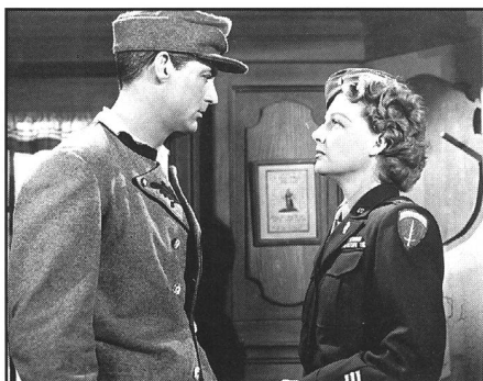
«I Was a Male War Bride»

Die Hollywood-Cowboys Gene Autry und Roy Rogers verklagen die Republic Pictures, weil sie Western ans Fernsehen verkauft. Schleppend kommt die Abkehr von der Tradition der Pioniere in Gang. Bei Mann ist die Grenze noch präsent, auf dem Bildschirm ist sie bloss eine Erinnerung. Während das überkommene Genre in die letzte Phase tritt, holt bereits die Science-fiction mit « The Day