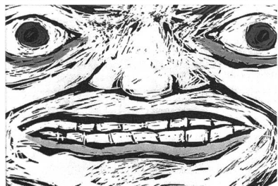
Bildphasen aus «Amok» von Claudius Gentinetta

Wenn die Agentur sich auch um Trickfilme kümmern wird, auf jeden Fall. Aber ehrlich gesagt, ich bin nicht sehr involviert in diese ganze Diskussion. Personen aus meinem Umfeld wie mein Produzent informieren mich gelegentlich über die neuesten Entwicklungen. In diesen Dingen bin ich ein «Larifari». Ich bin ein Typ, der in erster Linie seine Filme realisieren