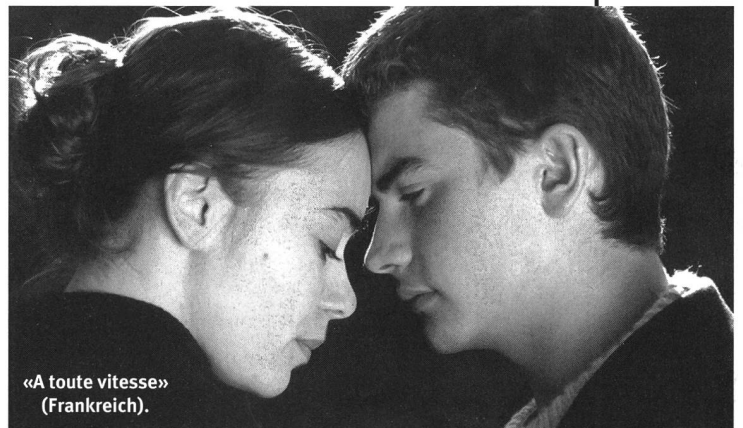
«A toute vitesse» (Frankreich).