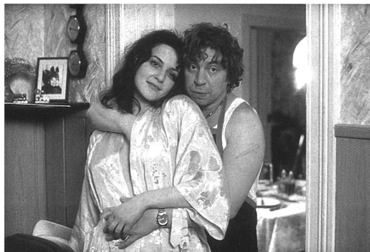
Bemerkenswerte Ausnahme: «Das Leben ist eine Baustelle»