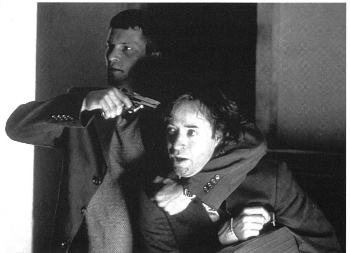
Spitzenreiter der letzten Jahre: «Knockin' on Heaven's Door»

Caroline Links emotionalisierte Selbstfindungs-