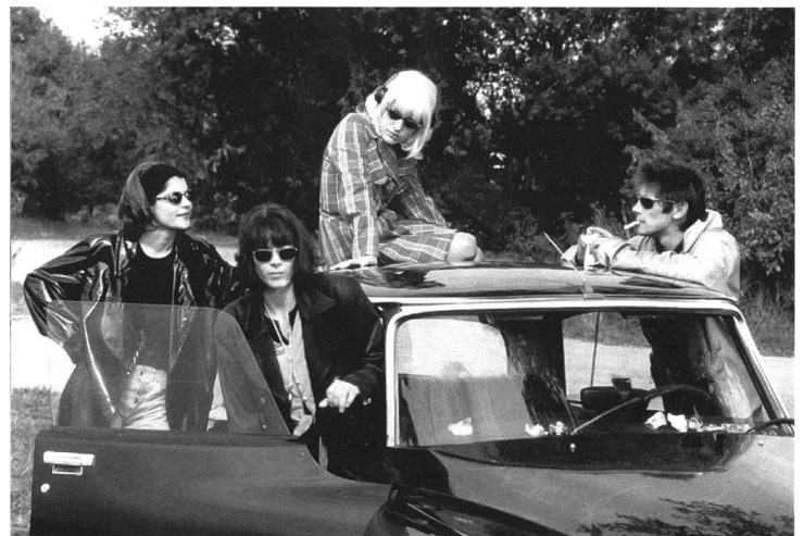
Billigversion von «Thelma & Louise»: «Bandits»

Damals wie heute gedeiht das deutsche Kino nur innerhalb der Grenzen des eigenen Sprachraums.