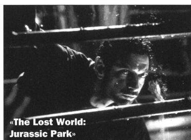
«The Lost World: Jurassic Park»