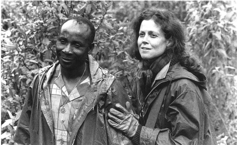
Bloss keine Erotik: «Gorillas in the Mist» (Michael Apted, 1988)

Schwarzen: Sie werden von Krokodilen gefressen, sie stürzen von Felswänden, und die am Schluss noch Verbleibenden werden vom erwähnten Riesenaffen des zwergwüchsigen Volkes umgebracht. So drastisch wie in diesem geht es in anderen Filmen zwar nicht zu und her, trotzdem ist nicht zu übersehen, dass zahlenmässig viel mehr Schwarze ihr Leben lassen müssen, während es die Weissen verstehen, allen Gefahren zu trotzen.