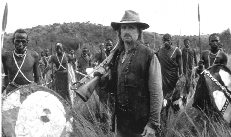
Schwarze im Dunkeln: «The Ghost and the Darkness» (Stephen Hopkins, 1996)

Dies sind lediglich ein paar Anmerkungen zu im Westen jahrzehntelang gültigen und akzeptierten Bildern über den afrikanischen Kontinent. Dass diese Vorstellungen auch im Kino zum Zuge gekommen sind, ist an sich nur logisch – und umgekehrt dürfte das Kino das seine zu deren Ausprägung beigetragen haben.