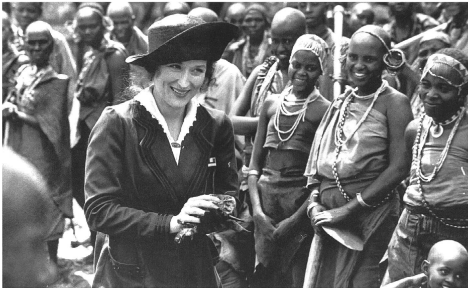
Dame in der Wildnis: «Out of Afrika» (Sidney Pollack, 1985)