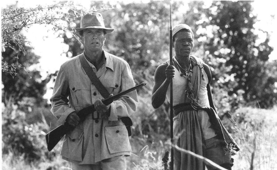
Weisser Jäger mit Assistent: «White Hunter, Black Heart» (Clint Eastwood, 1990)