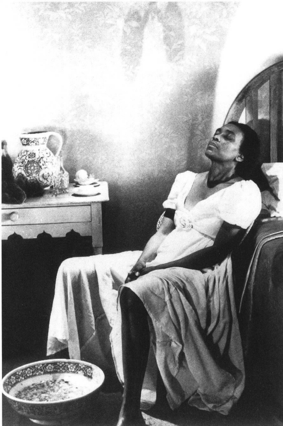
«Dreaming Rivers» von Martina Attila (Grossbritannien 1988)

weise beim Drehen von «Les bicots-nègres, vos voisins» (1973) ganz im Sinne etwa der Ästhetik des frühen Brecht: «Ich fragte eine (in Paris lebende) Gruppe von arbeitenden Immigranten (aus Afrika), ob sie mit mir (beim Drehen eines Filmes über ihre Probleme) zusammenarbeiten und auch im Film auftreten würden. Das war nicht immer einfach. Wir redeten und organisierten Treffen. Ihr Vertrauen war notwendig, und es konnte nur ein wirkliches Vertrauen sein, denn ich sagte ihnen ganz am Anfang, dass ich einen Film machen würde, der weder zu ihrem noch zu meinem blossen Vergnügen gedreht werden würde. (...) Meine Absicht war es, jede Form von revolutionärer Mystik zu vermeiden. (...) Ich ging allein von der Kraft des Bildes aus: Solide recherchierte Tatsachen sollten nicht hinter stilistischen Effekten verschwinden.»