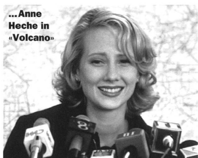
...Anne Heche in « Volcano »

Die Ursache für das neue Erscheinungsbild der Frau im Hollywood-Film liegt vermutlich in sehr viel simpleren Überlegungen begründet. Das ganze Genre der technisch aufgemotzten event movies ist nämlich vorrangig eine Män-