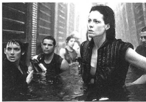
Alien Resurrection Alien – Die Wiedergeburt

Obschon die einzige Überlebende im dritten Film der Saga den (freiwilligen) Feuertod starb, lässt eine fortschrittgeile Wissenschaft sie zusammen mit bösartigen Aliens wieder auferstehen. Damit muss Ellen Ripley den Kampf erneut aufnehmen, um die Erde vor den üblen Viechern zu bewahren. Trotz einiger gelungenen Action- und Horror-Sequenzen und Sigourney Weavers faszinierendem Spiel reicht die Fortsetzung keinen Moment an die Dichte des Originals heran. – Ab etwa 14. → Kritik S. 30