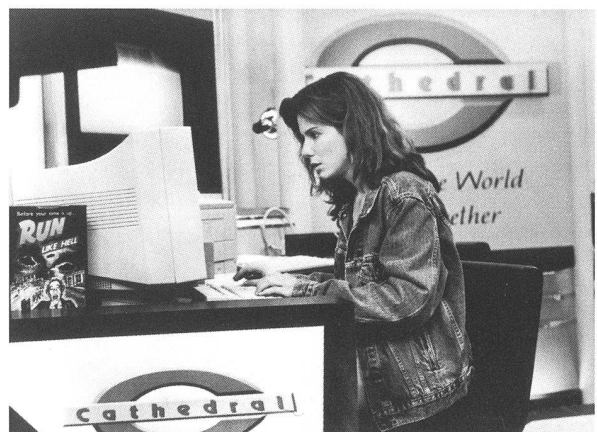
Kampf gegen die Computermafia: «The Net» von Irwin Winkler

Die Filmindustrie hat das Netz schon früh als Marketinginstrument für ihre Produkte entdeckt. Alle grossen Studios und Produktionsfirmen unterhalten aufwendig gestaltete sites mit Hintergrundinformationen zu ihren Filmen. So können multimediale Elemente wie Bilder, Trai-