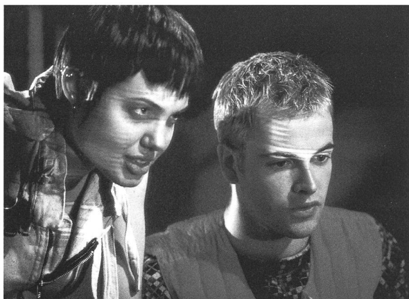
Wanderung im cyberspace: «Hackers» von Iain Softley