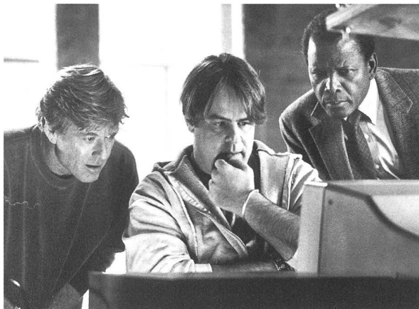
Computerexperten am Rand der Legalität: «Sneakers» von Phil Alden Robinson