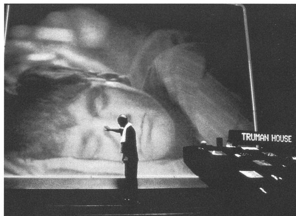
Künstlich produzierte Realität: «The Truman Show» von Peter Weir