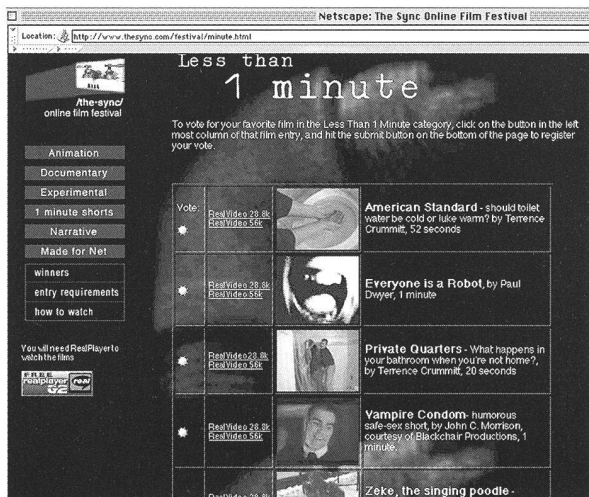
«The Sync»: Das erste Dauer-Filmfestival der Welt

Zusammenstellung von Internet-Adressen online unter www.zoom.ch