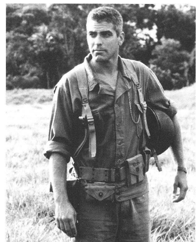
Hätte notfalls auch das Kamerazubehör geschleppt: George Clooney