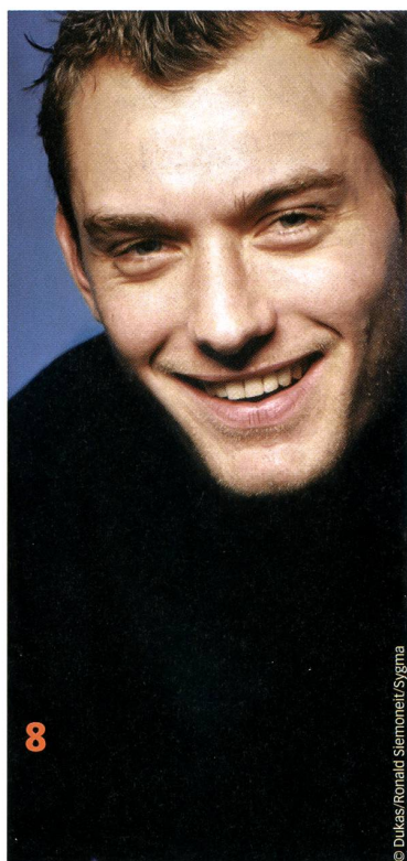
Vorläufig profiliert er sich noch in Nebenrollen: der vielversprechende Newcomer Jude Law