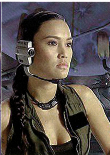
Lara Croft (links) kommt vom Computer auf die Leinwand, Tia Carrere (rechts) ist für «The Daedalus Encounter» den umgekehrten Weg gegangen. Und dazwischen liegt die digitale «Blackbox», hier in der Form der brandneuen «Dreamcaster»-Spielkonsole von SEGA.