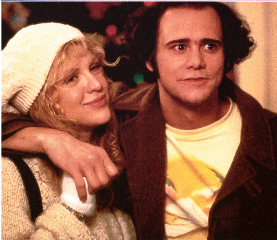
▲ Michael Manns «The Insider»: Die Tabakindustrie lief schon vor der Premiere Sturm.