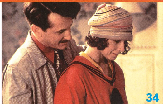
Sean Penn ist Jazzgitarrist Emmet Ray (hier mit Samantha Morton in der Rolle seiner taubstummen Freundin Hattie) in Woody Allens witziger Jazz-Hommage «The Sweet and Lowdown»