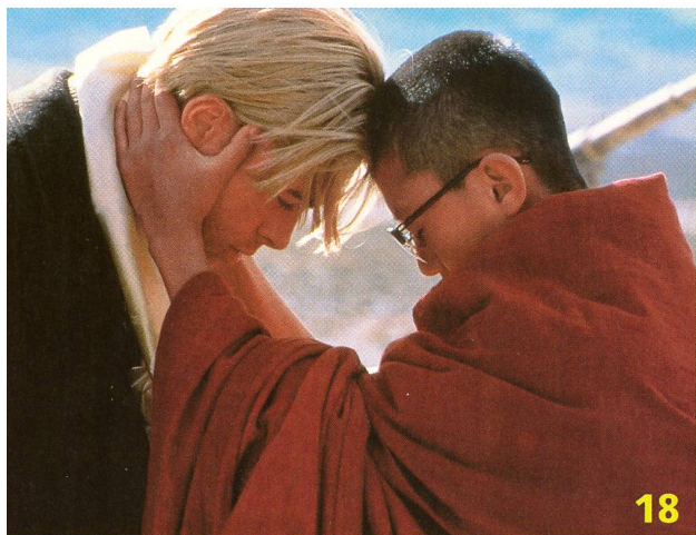
Jeder sucht sich seinen Guru selber. Auch Brad Pitt als Heinrich Harrer in «Seven Years in Tibet» von 1997